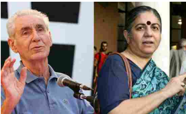
Stefano Rodotà e Vandana Shiva

Quest'anno parteciperanno, tra gli altri, Enzo Bianchi, Massimo Cacciari, Gianrico Carofiglio, Roberto Esposito, Umberto Galimberti, Michela Marzano, Salvatore Natoli, Ezio Mauro, Federico Rampini (lectio Rotary), Massimo Recalcati, Stefano Rodotà, Chiara Saraceno, Carlo Sini, Gustavo Zagrebelsky e Remo Bodei, Presidente del Comitato scientifico del Consorzio. Nutrita la componente di filosofi stranieri: tra loro i francesi Jean-Luc Nancy, François Hartog, François Jullien e Marc Augé, che fa parte del comitato scientifico del Consorzio; i tedeschi Aleida Assmann, Jan Assmann e Christoph Wulf, i britannici Zygmunt Bauman e Richard Sennett, l'americano Robert Darnton, l'indiana Vandana Shiva.